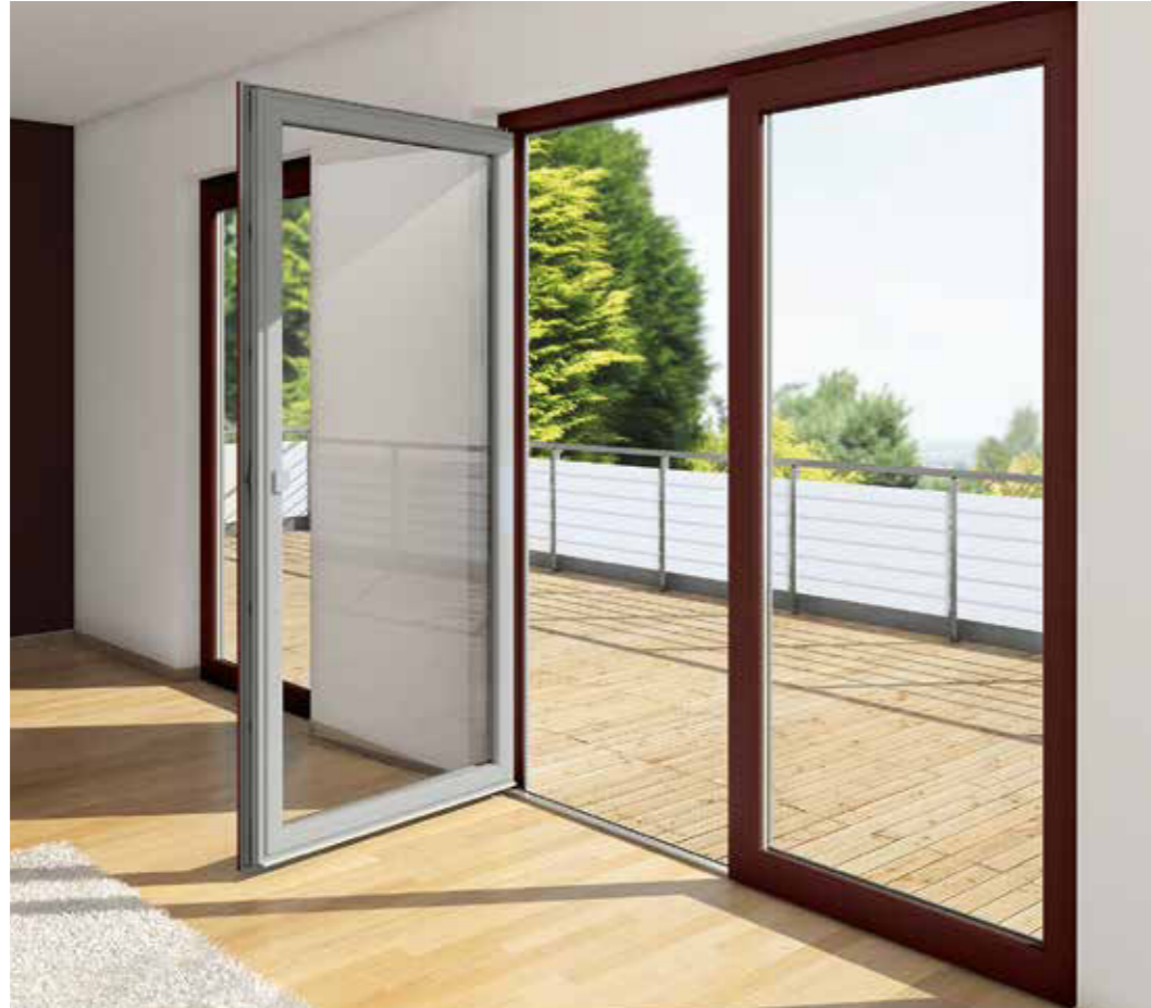
Kreative Möglichkeiten bei der außen- und innenseitigen Gestaltung mit Schüco AutomotiveFinish.