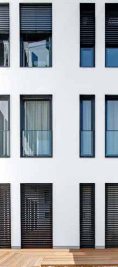
Mit Schüco AutomotiveFinish lassen sich neue gestalterische Impulse mit preislich attraktiver Leistung verbinden.